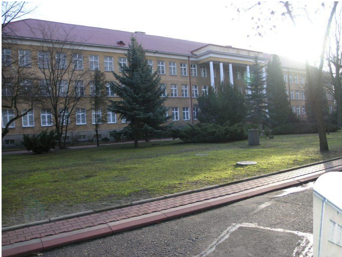
Akademia Obrony Narodowej w Warszawie