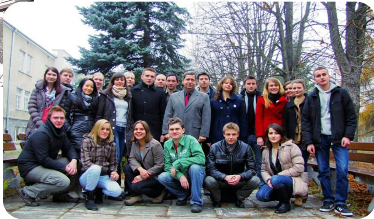
Zespół Koła Naukowego Studentów Logistyki AON